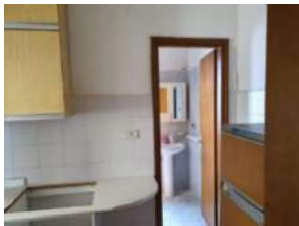
Via Terrazzini 129