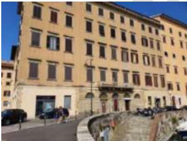
Via Scali del Corso 5